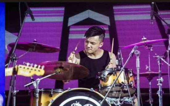
瞩目的不仅仅其主唱，还有支撑主唱的整team队员