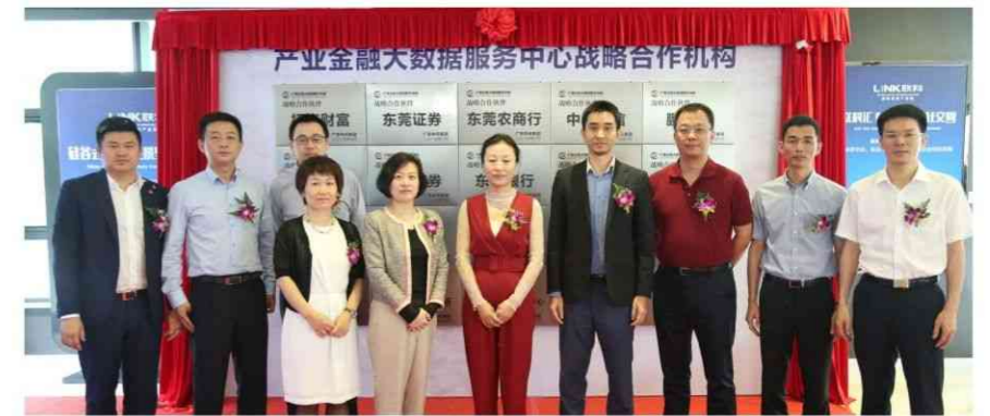
▲ 6月22日，中天产业金融大数据服务中心成立

“我们这个产金中心里有银行、基金、券商等多层次金融服务机构，能够满足入园企业不同阶段、从短至长甚或价值投资类的金融需求。通过我们的产金中心，金融机构可精准地找到客户，获取园区企业更为精确的经营数据、人员构成、