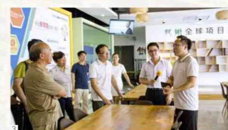
1 走访联科国际信息产业园 2 走访联丰创意谷内的东莞市外贸转型升级支援服务中心 3 走访联丰创意谷内的蚁巢两岸青年创业孵化器