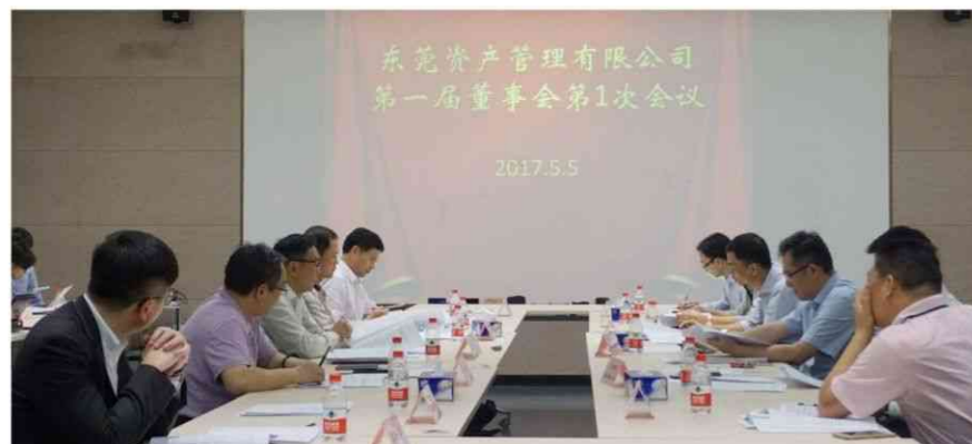
▲ 中天携手5家本土实力企业共同发起设立东莞资产管理有限公司