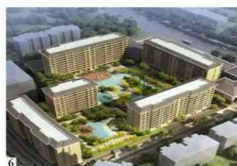
1 魅力之城 4 公园里 2 万科城 5 金域中央 3 金域蓝湾 6 澳门园