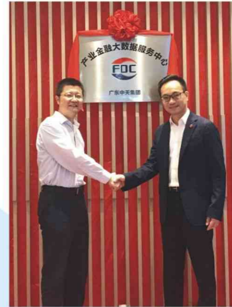
SHEN ZHEN 深圳